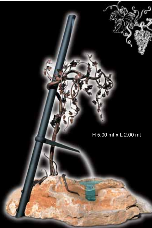
H 5.00 mt x L 2.00 mt

Nei laboratori artigianali l'arte e lo stile danno vita a complementi unici nel loro design.