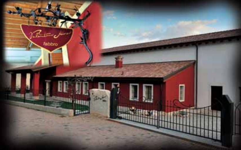
GRAFICHE BIRONCA - Monfalcone (TV)

Each piece starts from a drawing scrupulously prepared and studied, and is then composed in his large and luminous laboratory set in the magical context of the Miane hills. It is very close to the ancient manufacturers of Follina, which were famous during the Middle Ages, because renowned artistic metalworkers were already able to use the generous hydraulic energy produced in the Valley. Tradition and innovation are countersigning each artwork that is manually forged to satisfy all the requirements of those who desire a customized and unique object to exhibit as a symbol of the creative power of Nature; disposed by the masterful conformation of a gesture able to dominate iron.